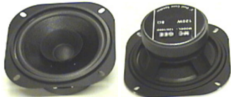
4" ja 5" mallit