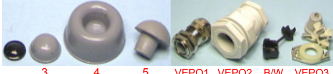
3 4 5 VEPO1 VEPO2 B/W VEPO3

Räkkikoteloiden kuulalaakeroidut teräksiset liukukiskot, käytetään mm. kiinnitettäessä 19" räkkikoteloita isompiin räkkeihin ym. Laadukkaat, liukuvat helposti, "naksahtaa" työnnettäessä kiinni ja vedettäessä ulos ääriäsi-entoon, (estää kotelon liukumisen itsestään vahingossa auki tai kiinni). Malli A : Pituus 30.5 cm / 51.5 cm (teräслиukuA) 14.00€ / pari Malli B : Pituus 41 cm / 70 cm (teräслиukuB) 14.00€ / pari