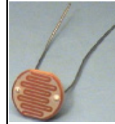
Iso "wanhanajan" LDR

suuri resistanssin muutos v-errattuna "tavallisiin" pieniin LDR -vastuksiin. Resistanssi kirkkaassa valossa vain kymmeniä ohmeja, pimeässä megaohmeja. Jännitekesto 180VDC max. tehonkesto 0.2W max. Ø 11.9 mm. ISO LDR 3.00€